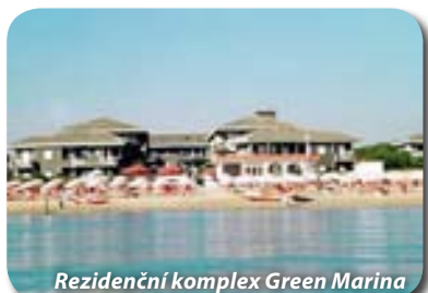
Residenční komplex Green Marina

ELENA CLUB RESORT APARTHOTEL**** – luxusní rezidence leží v jižní části Silvi Marina, cca 100 metrů od vlastní soukromé pláže. Recepce, restaurace, bar, terasa, fitness, bazén (vstup s koupací čepicí), parkoviště, vlastní pláž (zahrnuta v ceně). Mono 2/3 osoby a bilo 4. Všechny apartmány mají