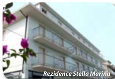
Rezidence Stella Marina