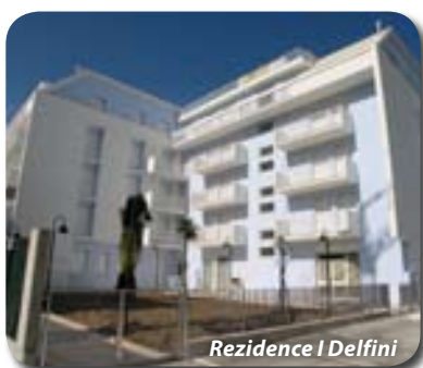
Rezidence I Delfini

Doprava: Vlastní nebo autobusem za 2 690 Kč/osoba (odjezd z ČR v pátek, příjezd do ČR v neděli).