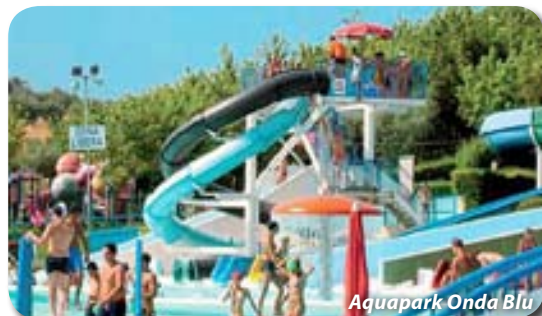
Aquapark Onda Blu